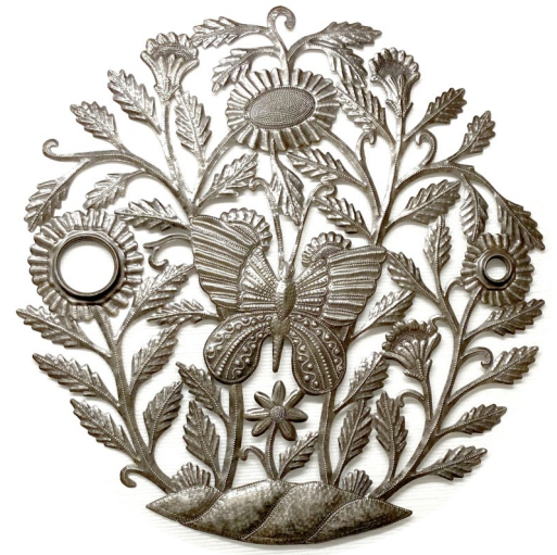
Sculpture Bosmétal : Bathard Diam 60 cm