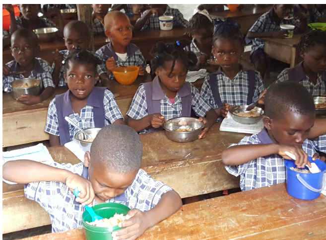
Cantine à l'école de Damier

Notre priorité reste la scolarisation des enfants défavorisés des écoles paroissiales de Verrettes et de La Chapelle en Haïti. L'association assure une participation aux cantines des écoles.