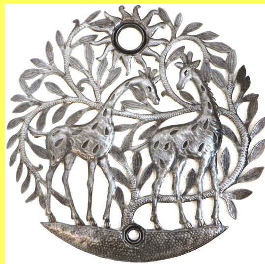
Bosmétal : Couple de girafes, artiste: Ch Thomas