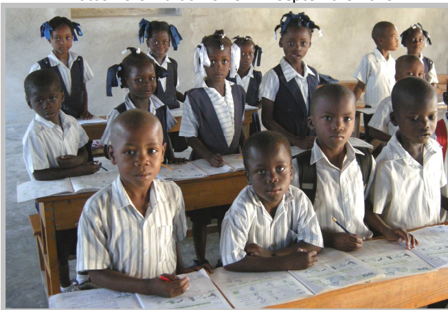
La rentrée scolaire 2015/2016 a eu lieu le lundi 7 septembre