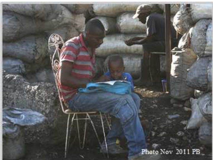
Photo Nov 2011