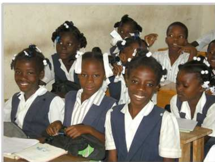
Elèves de St Guillaume La Chapelle Nov 2011 PB