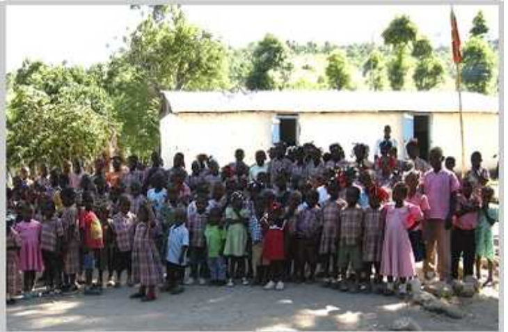
Ecole de Haut Bassin à Verrettes Nov 2011 PB