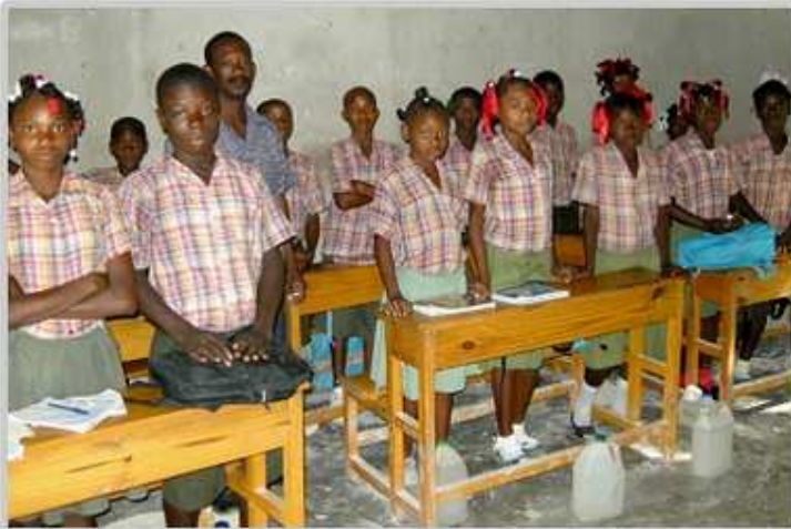
Ecole de Damier Verrettes Nov 2011 PB

Nous effectuerons le trajet retour à pied par un autre chemin moins difficile, en 4 h de marche, avant de retrouver le véhicule réparé. Belle journée riche en événements et en rencontres.